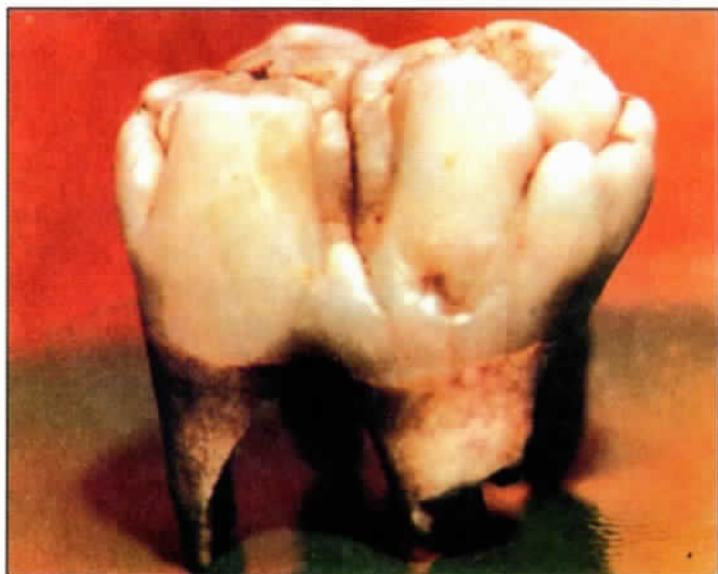
ဆရာတော်ဘုရားကြီး၏ မီးမခသော အံပွားတော်